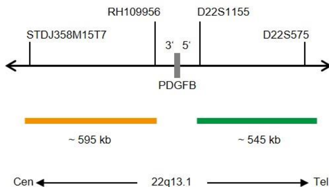
Fig. 1. SPEC PDGFB Mapa de la sonda (no está a escala)

*de acuerdo con el ensamblaje del genoma humano GRCh37/hg19